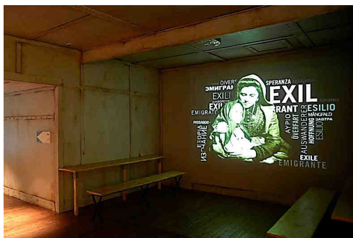
Dans l'entrepont des émigrants, évocation sensible de la destinée de 60 millions d'émigrants européens (J.C. Lemée).

> Auprès de l'équipage : des ponts à la timonerie, des cabines à la salle à manger sans oublier la salle des machines, l'équipage réglait la marche du navire tout en étant attentif aux besoins des passagers. Certains membres de l'équipage étaient en contact direct avec les passagers, d'autres restaient invisibles le temps de la traversée. Dans Escal'Atlantic, l'équipage constitue un fil rouge, à travers des photos et films d'archives et dans des lieux comme les chambres froides, la timonerie ou le salon du commandant .