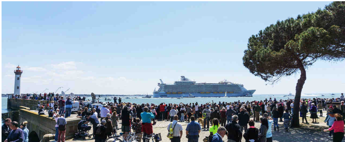
Départ de l' Harmony of the Seas en mai 2016

Depuis 1862, les chantiers navals de Saint-Nazaire ont construit plus de 120 paquebots (de ligne et de croisière), dont 36 pour la Compagnie Générale Transatlantique. Le 122 e paquebot « made in Saint-Nazaire » a été commandé par l'armateur Royal Caribbean International. Harmony of the Seas , livré en mai 2016, est actuellement le plus grand paquebot de croisière du monde. Son frère jumeau et de grands paquebots pour l'armateur MSC - le MSC Meraviglia a été livré en mai 2017 - sont en cours de construction.