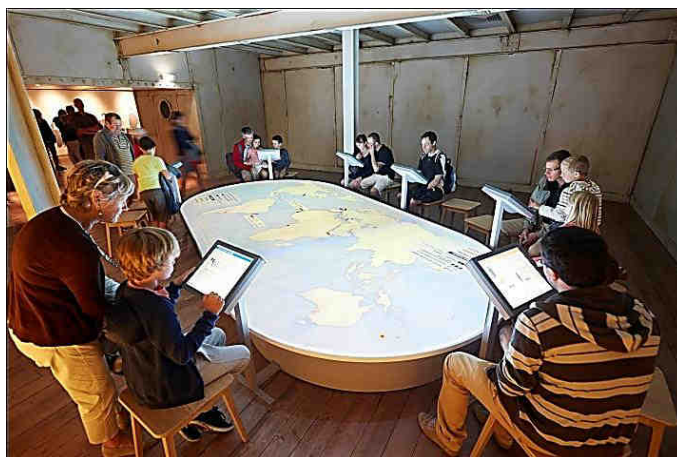
Autour de la mappemonde animée, chaque poste de jeu correspond à une ligne transocéanique (J.C. Lemée).

L'exploitation des lignes : autour d'une grande mappemonde animée dans la cale du « navire », le visiteur se glisse dans la peau d'un directeur de compagnie maritime. Il devra constituer sa flotte et assurer les traversées régulières dans le respect de la convention passée avec l'Etat, sans négliger le bien-être des passagers. Pas si simple, surtout si des incidents imprévus obligent à prendre rapidement des décisions... en pleine mer !