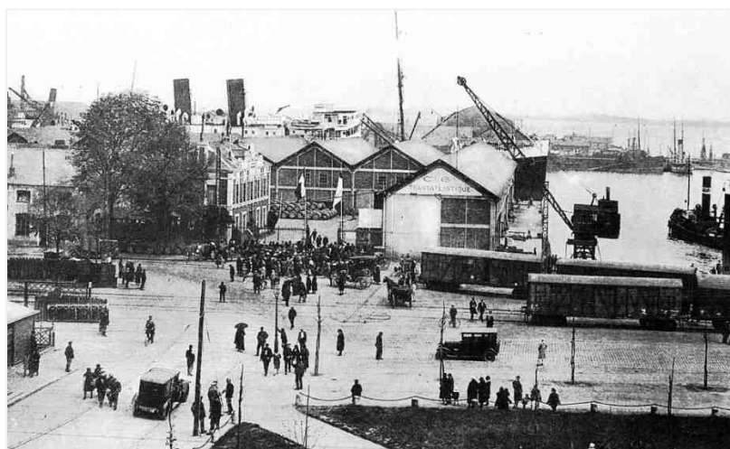
Agence de la Transat à Saint-Nazaire vers 1925 ; arrivée du paquebot Pérou .

Port transatlantique dès 1862 , Saint-Nazaire est tête de ligne pour les liaisons régulières vers l'Amérique Centrale jusqu'à la veille de la Seconde Guerre mondiale. Les installations de la Compagnie Générale Transatlantique, la célèbre Transat, laisseront alors la place à la base sous-marine construite par l'armée allemande. Le trafic régulier transatlantique ne reprendra pas après la guerre. À la fin des années 1990, dans le cadre du projet urbain Ville-Port, un équipement touristique et culturel sur le thème des paquebots est créé à l'intérieur de la base sous-marine : Escal'Atlantic est né. Les visiteurs d'aujourd'hui embarquent dans les pas des passagers d'hier.