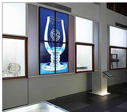
Montage audiovisuel dans la salle à manger, mettant en valeur les collections (J.C. Lemée).

Le cinéma et la photographie -nés presque en même temps que les grands paquebots- apportent encore une autre dimension et ont une place prépondérante dans la scénographie. L'image d'archives dit autant la puissance des navires ou le goût des passagers pour le jeu social à bord, que la gravité et l'inquiétude des émigrants confrontés à l'exil et à leur première expérience de la mer. Les montages audiovisuels, les contenus des cartels numériques, des dispositifs multimédia et des jeux ont été créés spécifiquement pour Escal'Atlantic.