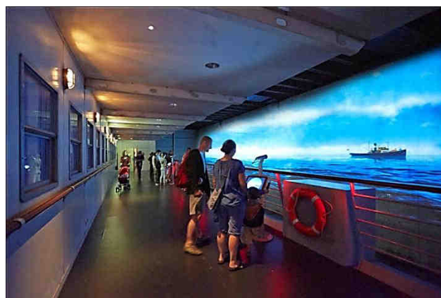
Photos ci-dessus : évocation de France avec mobilier de cabines et œuvres décoratives provenant du paquebot (J.C. Lemée) ; descente du bar à la salle à manger, tapisseries du France (C. Raynaud de Lage) ; la salle des machines (J.C. Lemée) ; le pont promenade et le spectacle du grand large (J.C. Lemée).