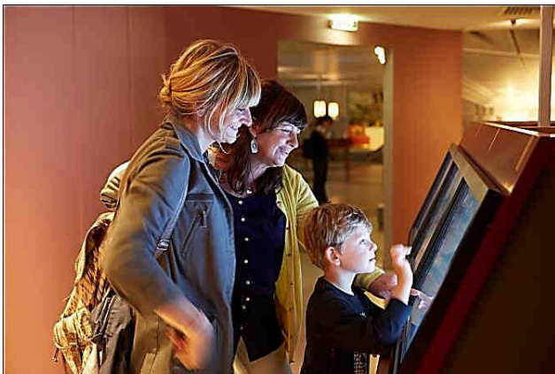
Des extraits d'un film des années 1930 animent un plan de paquebot (J.C. Lemée).

Certains dispositifs ont été imaginés à partir de documents d'origine . Une reproduction agrandie du plan des chambres froides du paquebot Ile-de-France (1927) couvre tout un pan de mur ; des « fenêtres » permettent de voir les vraies chambres froides du navire grâce aux extraits d'un film tourné à bord dans les années 1930. Impressionnante découverte que ce garde-manger surdimensionné où étaient stockés les vivres pour 2 000 personnes et six jours de traversée !